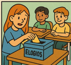
LA CAJA DE LOS ELOGIOS