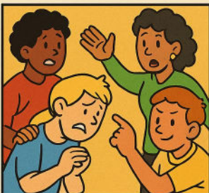
ROLE-PLAY DEL "CAMBIO DE ROL"