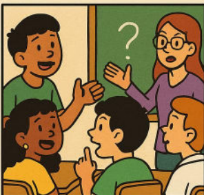
DEBATE DE VALORES